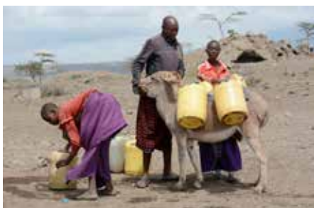
Maasaimädchen beim Wasserholen

Für die „Eine Weltgruppe Kastelruth“ Wolfgang Penn