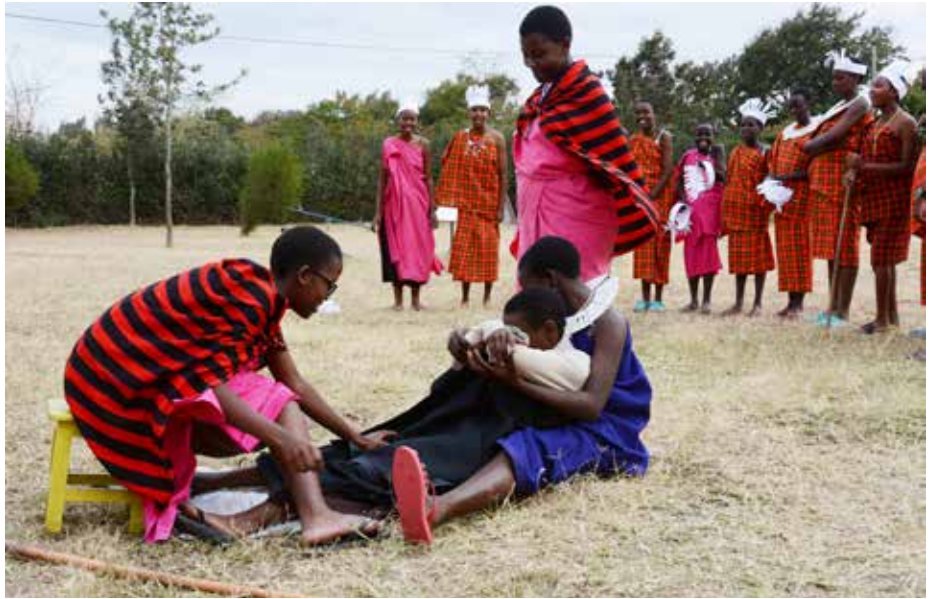
Szene einer Beschneidung nachgestellt für den Film

Mit einem neuen Bildungsprojekt dessen Teilfinanzierung von der Südtiroler Landesregierung bereits genehmigt wurde, wird unter der Schirmherrschaft von Tamara Lunger, dem Südtiroler Verein Circle in Zusammenarbeit mit Missio, der Eine Welt Gruppe Kastelruth und den Projektpartnerinnen in Tansania den Maasai Mädchen die