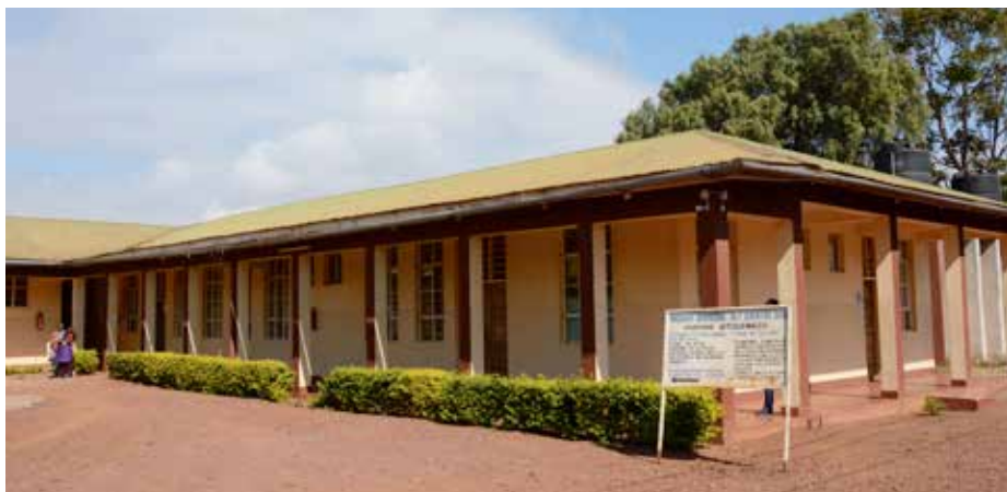
Krankenhaus in Ngarengairobi, Projekt der EWG Kastelruth

In fast allen Maasaidörfern in dieser Gegend, wird die weibliche Genitalverstümmelung (FGM - Female Genital Mutilation) immer noch praktiziert. Meist werden die Mädchen zwischen neun und zwölf Jahren, unter schlimmsten hygienischen Bedingun-