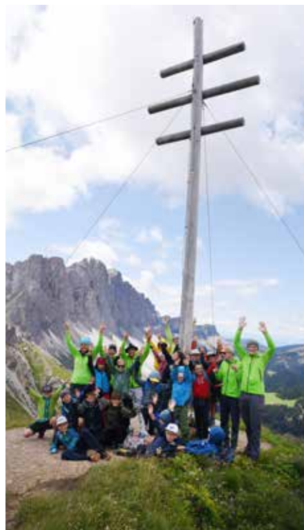
Gipfelwanderung Zendlerserkofel 2.422 m