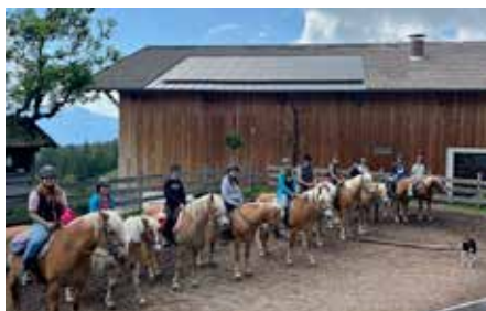
Die Jugendlichen vor dem Start beim Oberfahrer-Hof

Am Wochenende vom 10. und 11. Juni fand in Jenesien das erste Reitwochenende unter dem Namen „Ritt in den Sommer“ statt. Egal ob erfahrene Reiter*in oder Anfänger*in, insgesamt nahmen zehn pferdebegeisterte Jugendliche aus dem Einzugsgebiet des Jugenddienst Bozen-Land am Wochenende teil. Ausgangsort war der Reiterhof „Oberfahrer“ in Jenesien, welcher neben den erfahrenen Reite-