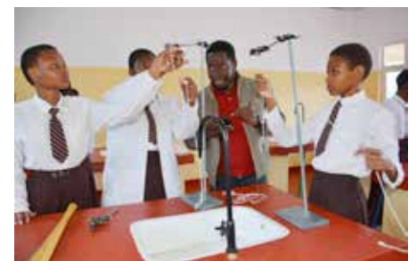
Schüler*innen im Physikraum